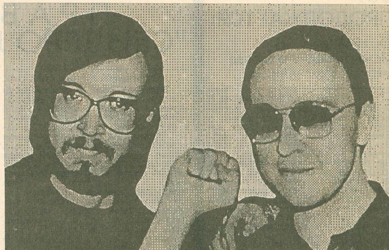
Егор ЛЕТОВ - Игорю МАЛЯРОВУ

ГАЗЕТА РОССИЙСКОГО КОМУНИСТИЧЕСКОГО СОЮЗА МОЛОДЕЖИ № 4 (15) ИЮНЬ-ИЮЛЬ 1994 г.