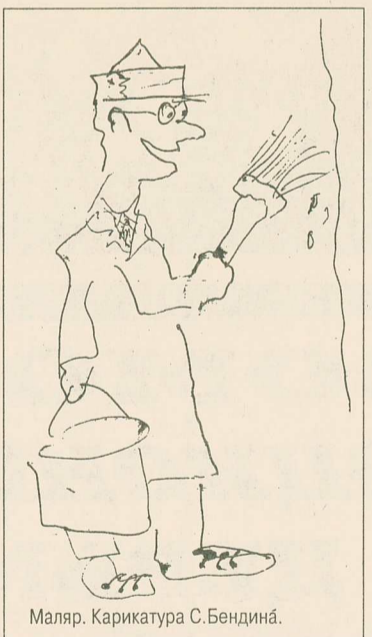
Маляр. Карикатура С. Бендин.

По-настоящему «независимый» молодежный союз может существовать, если только теоретически, идейно, организационно, и, в частности, материально-технически он превосходит существующие партии. Но тогда он сам неизбежно превращается в новую партию. «Внепартийная» общественная организация — или временная иллюзия, обусловленная несформированностью партий, или вредный обман, вроде мелкобуржуазной теории «общенародного», «внеклассового государства».