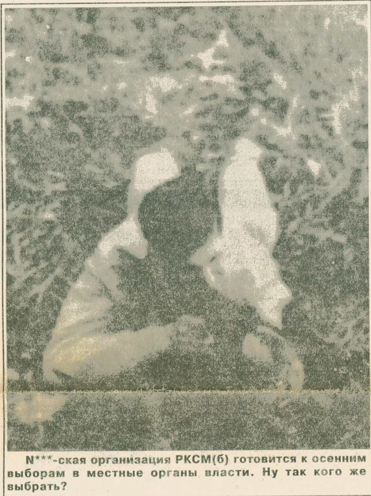
Н***-ская организация РКСМ(б) готовится к осенним выборам в местные органы власти. Ну так кого же выбрать?