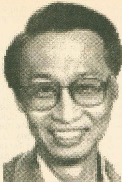
Хосе Мария Сисон

от роли американской марионетки и проводить самостоятельную внешнеполитический курс. В то время он занимал пост исполнительного секретаря общества дружбы Филиппины - Индонезия и в 1962 году в качестве стипендиата ЮНЕСКО был направлен на двухлетнюю стажировку в Индонезию