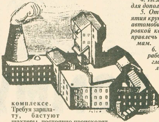
Комплексе. Требуя зарплату, бастуют шахтеры, постоянно происходят отключения электроэнергии как в жилом, так и в промышленном секторе, а жители Владивостока в знак протеста перекрывают городские магистрали - это достаточно хорошо освещалось средствами массовой информации.

О положении в Приморском крае, где сложилась крайне сложная обстановка в топливно-энергетическом