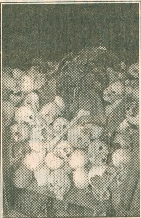
“...средства не настолько варварские и ужасные, чтобы можно было занести их в разряд неприемлемых...”

рядок лучше заряженным. Только тогда успех возможен. В военном лагере нужна единая воля. Организация должна строиться на основе полного единства мнений, единомыслия, во всех обстоятельствах она должна демонстрировать спаянность действия, а не пустое теоретико-практическое доктринерство. Партия - это армия. Это сила, одержимая волей к победе. А без единоначалия (имеется в виду не единоличная власть лидера партии, а единство всех начал, общая единая воля партийного коллектива) требуемое единство невозможно. Так что “авторитарная” власть руководства в партии более чем оправдана - необходима. Естественно, при условии выборности и сменяемости руководства и всеобщего подчинения принципам децентрализма.