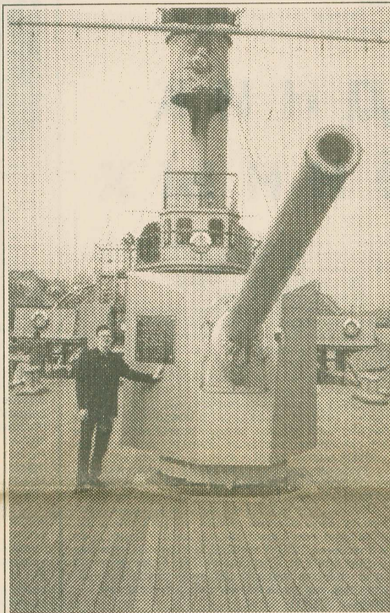
Старая железяка ещё сослужит неплохую службу

Как-то весной в автобусе я встретил старика, который ехал с митинга левого пенсионерского "Движения ограбленного народа" и рассказывал окружающим о своей жизни. При Сталине он попал в лагерь, отсидел пять лет,