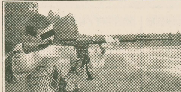
В лагерях комсомольцы овладевает не только умением метко стрелять, но и искусством верного выбора цели.

В первый же день состоялся концерт, показавший, что принцип партийности искусства здесь не в чести. Звучали политически некорректные песни: о пожарнике (это при Сталине-то!), "мы - русские, а русские не сдаются". Мы не выдержали и ушли, когда вышел "ка-