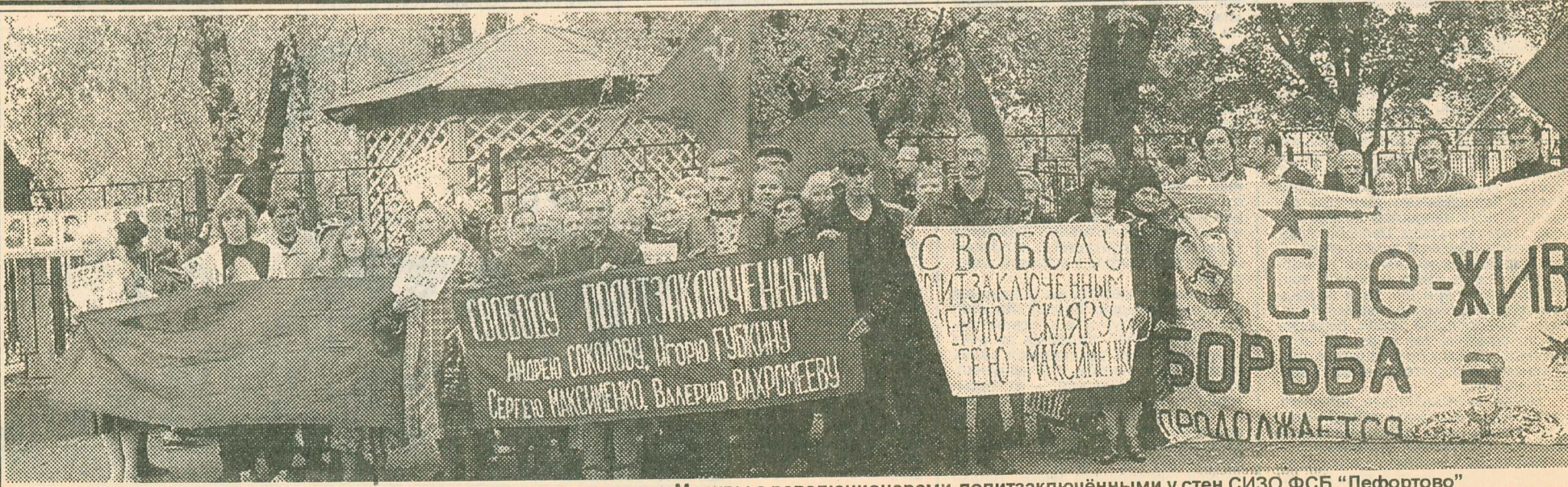
Митинг-пикет солидарности коммунистов и комсомольцев Москвы с революционерами-политзаключёнными у стен СИЗО ФСБ "Лефортово"