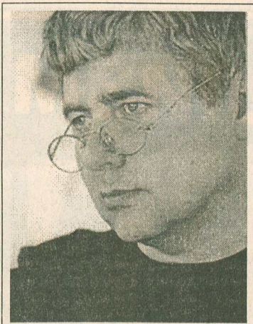
Автор проекта «Путин» предсказывает революционизацию молодежи

По закону маятника в России наступает послереволюционная реакция. она сносит общество влево, и левым приходится воевать с маятником. Парадокс не такой уж редкий, аналогом может