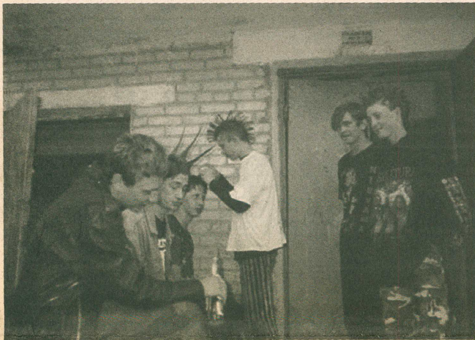
золотыми в палец толщиной и с девочками с ногами из ушей. Эти занимают первые ряды и балконы.

В остальном зале тоже не ши лаптем хлебующие собираются. Сидят вот они все на «леонтьеве-газманове» и радуются. И сам «леонтьев-газманов» радуется — и рот вдохновенно так под фанеру разевает. А бывает еще неферы какие-нибудь понаприезжают. Панки хайрастые из соседней области или даже из Питера. У них все действие уже более-менее натурально. Гитары стратакастеры с навороченными «примочками», музыка уже попсытиной так не воняет и даже дух вокруг витает совсем другой.