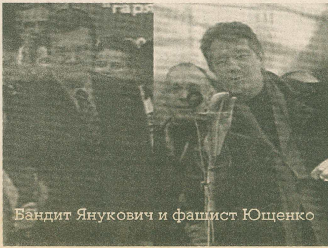
Бандит Янукович и фашист Ющенко

ес прозападная буржуазии, представляемой Ющенко и Тимошенко, заключается в получении прибылей от делового сотрудничества с Западом. Сотрудничать с Россией пророссийской буржуазии экономически выгодно, в этом (ее, буржуазии) классовый интерес, в этом залог того, что мой брат из Луганска никогда не будет воевать со своим братом в Ниж-