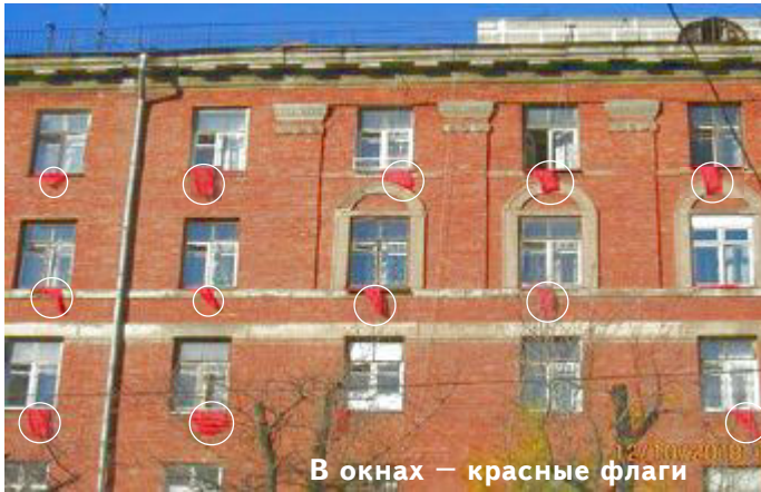
В окнах — красные флаги