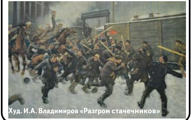
Худ. И.А. Владимирова «Разгром стачечников»