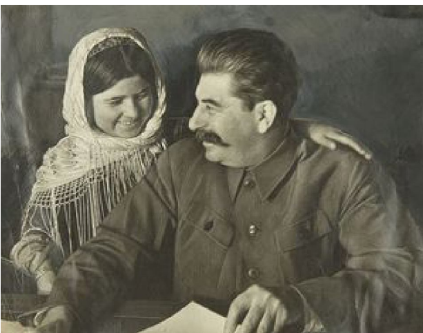
Фотография И.В. Сталина с Мамлакат Наханговой облетела весь мир

Судя по всему, Мамлакат Нахангова начала искать приемы быстрого сбора хлопка ещё до рекорда Стаханова. «В ней бес сидит», — с оттенком восхищения, смешанного со страхом, говорили старики. А некоторые незональные колхозники однажды избивали девочку. Чтобы не высывалась. Но Мамлакат продолжала свои поиски. И придумала, как можно быстро собирать хлопок.